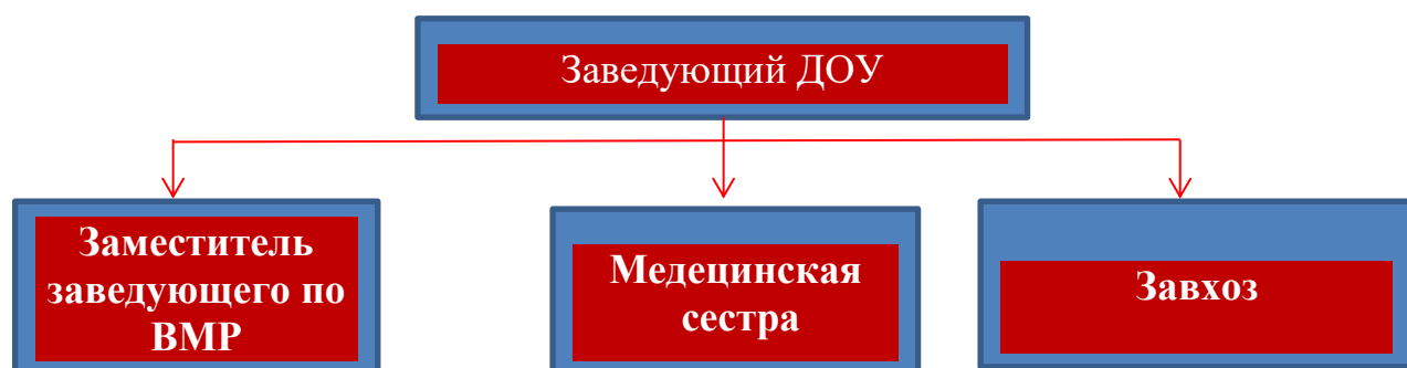
Схема. II направление – административное управление

Общее родительское собрание действует по плану, входящему в годовой план работы ДОУ. Общее родительское собрание собирается не реже 2 раз в год.